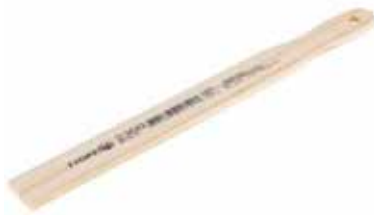
REF. 2300 Mezclador Madera p/ Pintura