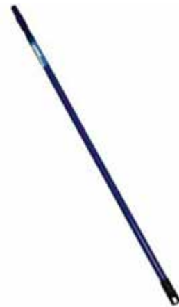
REF. 1307-2/ 3 Extensor Telescopico