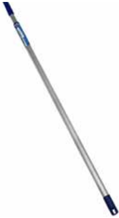
REF. 1308 Extensor Telescopico Metálico

Composición Aluminio roscado en plástico azul de punta Click