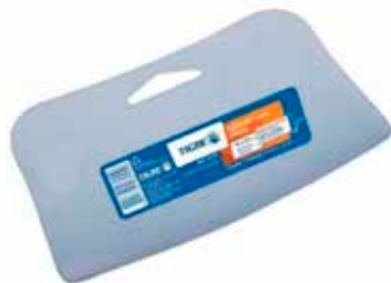
REF. 2171-01/ 02 Espatula Plástica p/ Masilla