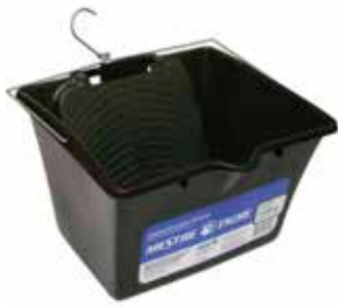
REF. 1309 Balde de Plástico