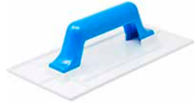
REF. 2116 Llana Plástica Base Porosa

Masilla Textura Rústica Efecto Grafiato Composición Base Plástico Poroso Mango Plástico Asa Cerrada