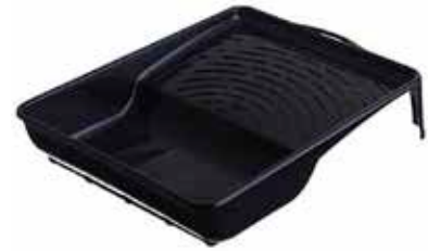
REF. 2304 Bandeja Plástico Negra