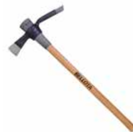
Hacha + Azada c/ Mango