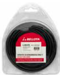
Hilo Bordeadora Negro