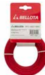
Hilo Bordeadora Rojo