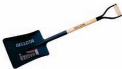
Pala Forjada Ancha