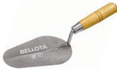
Cuchara Albañil Redonda

Para preparación y aplicación de la mezcla de cemento o mortero sobre paredes, soportes y estructuras en obras de construcción