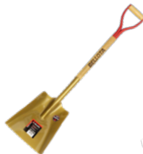
Pala Ancha Dorada