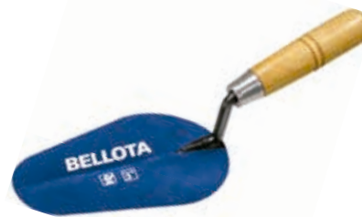
Cuchara Albañil Forjada Española