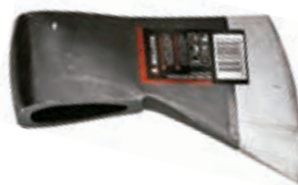
Hacha Bellota Forjada