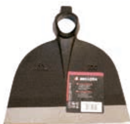
Azada Forjada Recta 2,5 L

Para cortar césped, hierba alta, maleza y pequeñas leñosas. Ideal para terrenos con piedras. El complemento perfecto para los Yoyos dispensadores. Gran variedad de referencias