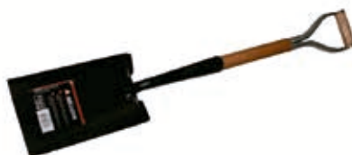
Pala Forjada Recta