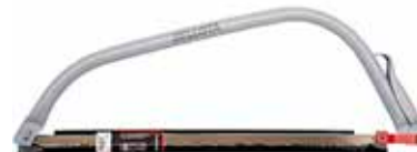
Serrucho P/ Rama

TA100421 4539-21 TA100424 4539-24 TA100430 4539-30