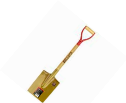
Pala Recta Dorada