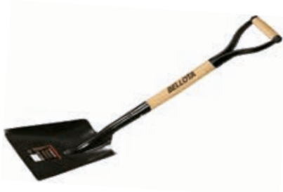
Pala Estampada Ancha