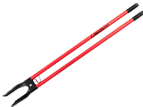
Pala Excavadora c/ Mang Metal