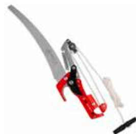
Podadora de Ramas s/ Mango