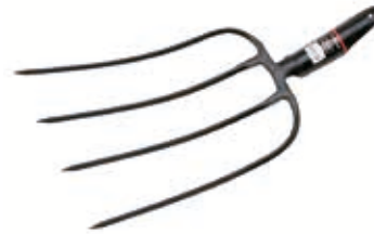
Horca Forjada España