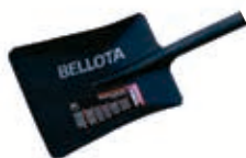
Pala Forjada Ancha

Pala para la remoción de escombros, para hacer orificios en la tierra, perfilar orillas y recolectar.