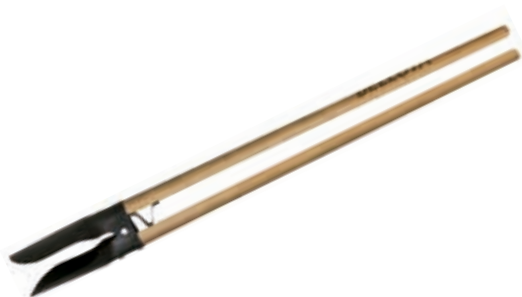
Pala Excavadora Med.