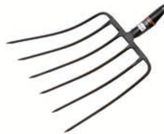
Horca Forjada España