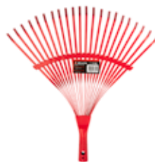
Escoba Metalica 22 D