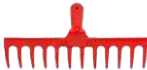
Rastrillo Metálico 12D