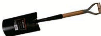
Pala Forjada 1/2 Luna