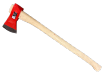
Hacha Bellota c/ Mango