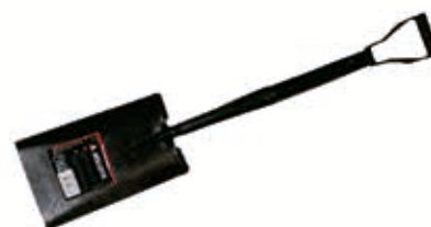
Pala Forjada Recta