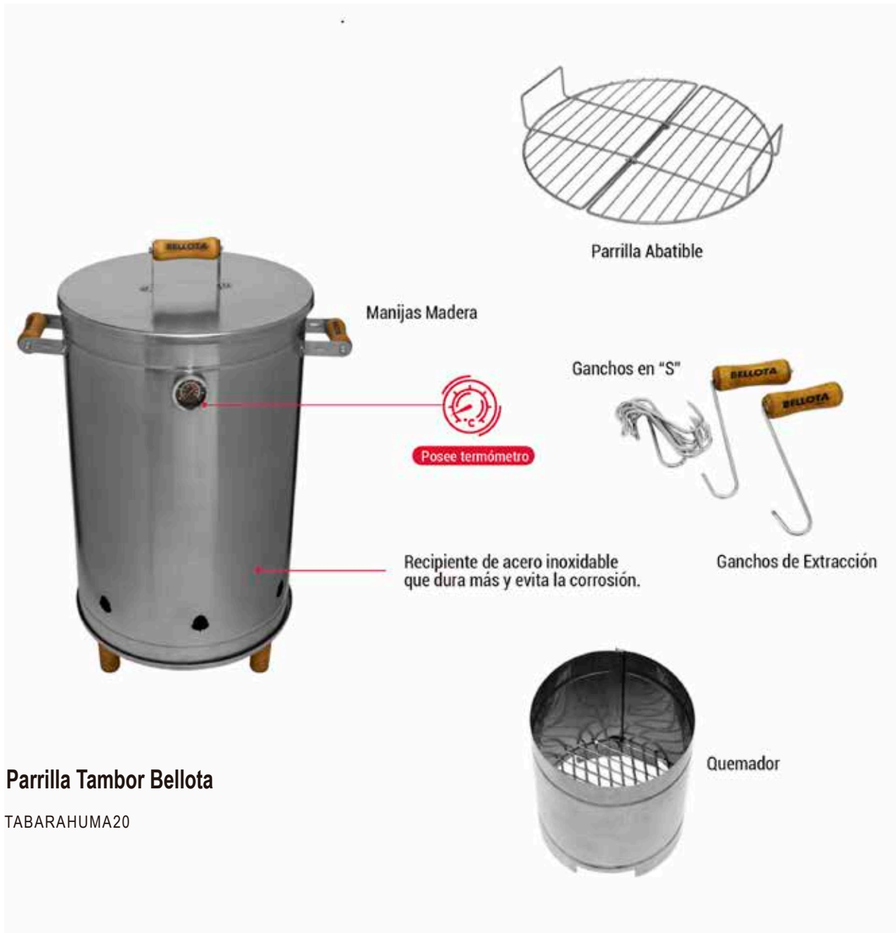
Parrilla Tambor Bellota