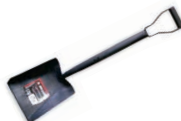
Pala Forjada Ancha