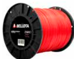
Hilo Bordeadora Redondo Rojo