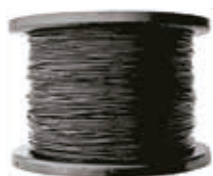
Hilo Bordeadora Cuadrado

Para cortar césped, hierba alta, maleza y pequeñas leñosas. Ideal para terrenos con piedras. El complemento perfecto para los Yoyos dispensadores. Gran variedad de referencias