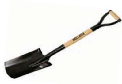
Pala Estampada 1/2 Luna