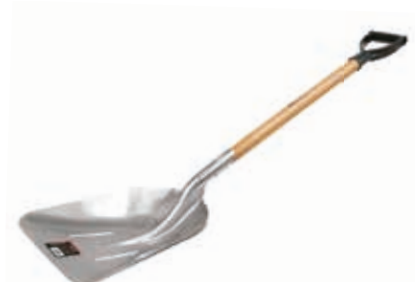
Pala Carbonera Aluminio