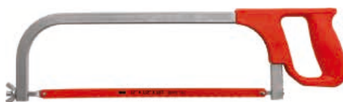
Arco p/ Sierra

Para corte de perfilaría, acero, aluminio, pvc, entre otros.