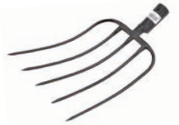
Horca Forjada España