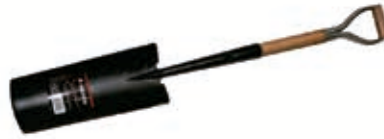
Pala Puntear Forjada