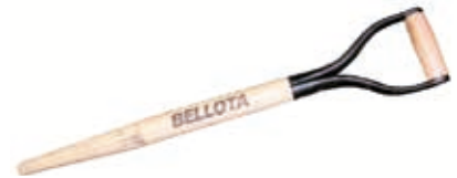
Mango p/ Pala