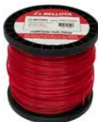
Hilo Bordeadora Rojo