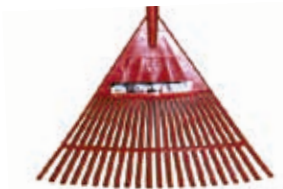
Escoba Plástica s/ Mango 22D