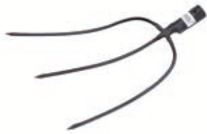
Horca Forjada España

Para recoger paja, heno y estiércol con facilidad gracias a sus púas afiladas y templadas en toda su longitud