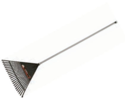
Escoba Plástica c/ Mango 22D

Para barrer y arrastrar grandes volúmenes de prado, hojas y ramas pequeñas