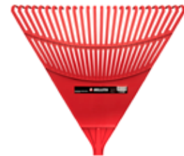
Escoba 26D s/ Mango