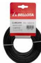
Hilo Bordeadora Negro