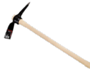
Pico + Azada