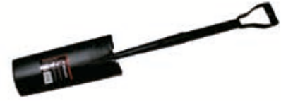
Pala Puntear Forjada