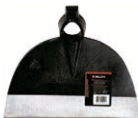
Azada Forjada 1/2 Luna