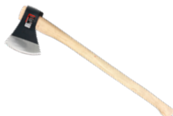
Hacha Bellota Forjada c/ Mango