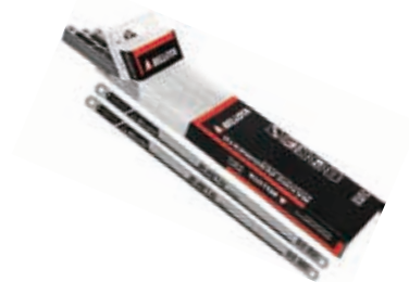
Hoja Sierra Bimet