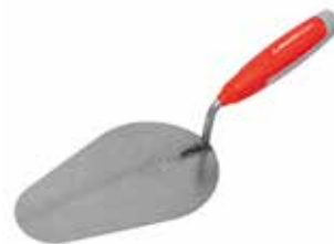
Cuchara Albañil Mango Plástico