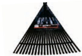
Escoba Plástica s/ Mango 22D