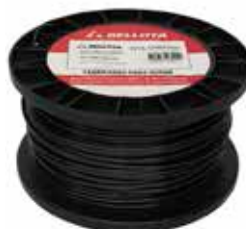
Hilo Bordeadora Negro