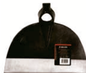
Azada Forjada 1/2 L