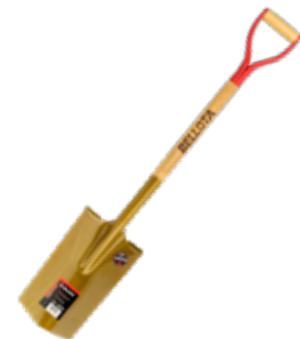
Pala 1/2 Luna Dorada