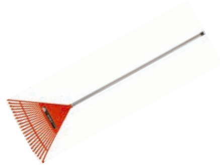
Escoba Plástica c/ Mango 22D