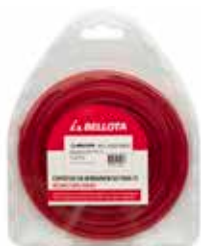
Hilo Bordeadora Rojo