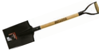
Pala Estampada Recta