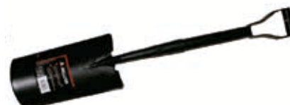
Pala Forjada 1/2 Luna