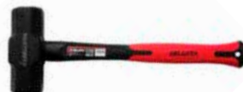
Mazo Mango Fibra