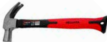
Martillo Uña Mango Fibra