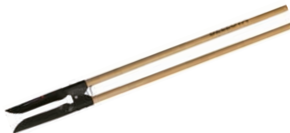
Pala Excavadora Med.